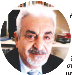
Γράφει και επιμελείται ο Κωνσταντίνος Βολάκης