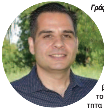
Γράφει ο Γιώργος Αμίντας

Κτυπάει το τηλέφωνο, μεταξύ πολλών άλλων τηλεφωνημάτων την ίδια στιγμή, και δεν προλαβαίνω να απαντήσω την κλήση. Η αναγνώριση μου έδειξε ένα γνώριμο όνομα που πάντα έχει να μου μεταφέρει κάτι σημαντικό. Επιστρέφω την κλήση και ύστερα από τα τυπικά καλησπερίσματα βρίσκομαι μπροστά σε μια μεγάλη και δυσάρεστη έκπληξη. Αυτό που ακούμε στην τηλεόραση, αυτό που διαβάζουμε στα social και το ξορκίζουμε από την ασφάλεια του πληκτρολογίου μας, τώρα είχε συμβεί στην πραγματικότητα και δέκτης αυτής της καταγγελίας ήμουν εγώ. Τώρα πρέπει να κάνω πράξη τα εύκολα λόγια του πληκτρολογίου.