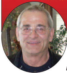
Γράφει ο Μιχάλης Κανάρσιος