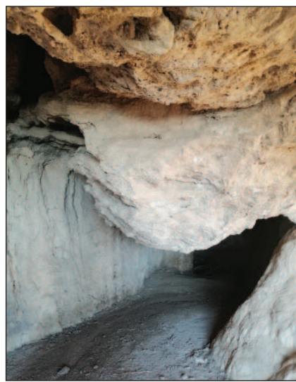
Σπηλιά του Κύκλωπα