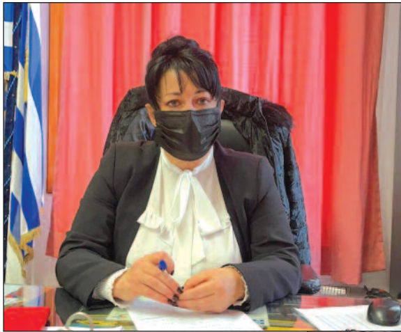
Ρεπορτάζ: Ραφαέλα Βατάκη

Στόχος η αξιοποίηση όλων των ανεκμετάλλευτων τετραγωνικών του Νοσοκομείου.